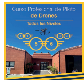
Todos los niveles

Encuentra packs, financiación y más opciones en droneprix.es